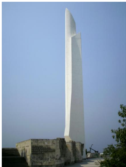
Обелиск "Штык-парус" в честь присвоения Севастополю звания города героя.

3 ноября 1977 г в честь вручения городу герою ордена Ленина и медали «Золотая Звезда», на мысе Хрустальный, был открыт обелиск «Штык-парус». Монумент выполнен в виде стилизованного паруса и штыка из монолитного железобетона и алюминиевой плитки.