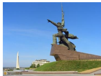
Мыс Хрустальный, вдали виден обелиск городу-герою "Штык- парус"