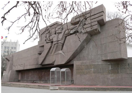
Мемориал героев обороны Севастополя 1941 - 1942 гг.

В память о героической битве при Сапун – горе, у ее подножия, в 1944 г. возвели обелиск Славы. На самой горе также находится мемориальный комплекс, увековечивший доблестную память о героях-освободителях Севастополя.