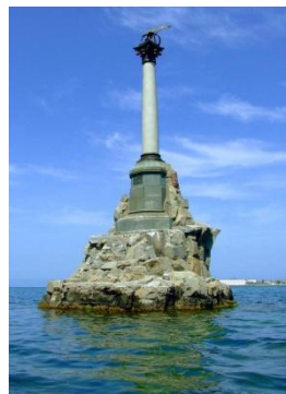
Памятник затопленным кораблям - символ города