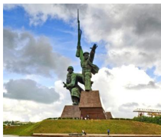
Матрос и солдат, 2007 г.

На бетонной стене памятника изображен отражающий два штыка воин-герой. Штыки символизируют два неудачных штурма противника в ноябре - декабре 1941 г. В центре мемориала находятся доски из гранита, на которых выгравированы названия боевых частей и соединений Черноморского флота, Приморской армии и севастопольских предприятий, работавших на нужды фронта.