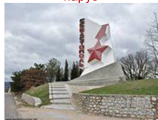
Памятный знак «Город- герой Севастополь» на въезде в город